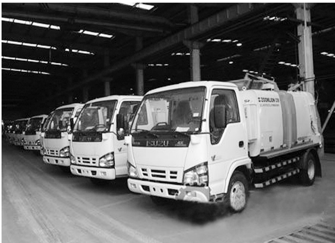
统计数据显示,2013年1~8月,湖南环境污染防治专用设备产量为21835台,同比增长5.36%。图为湖南省中联重科生产线正待出厂的餐厨垃圾收集车。