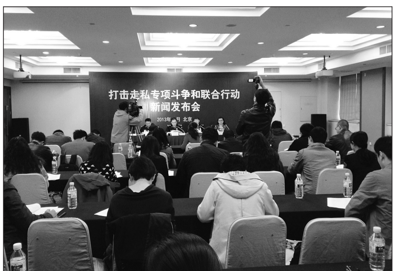
图为打击走私行动新闻发布会现场。

在欧美发达国家通常由政府指定专业的固体废物处理机构以深埋或密闭环境下焚烧的方式销毁“废粉”。2009年起,我国明确将其列为国家禁止进口的固体废物。