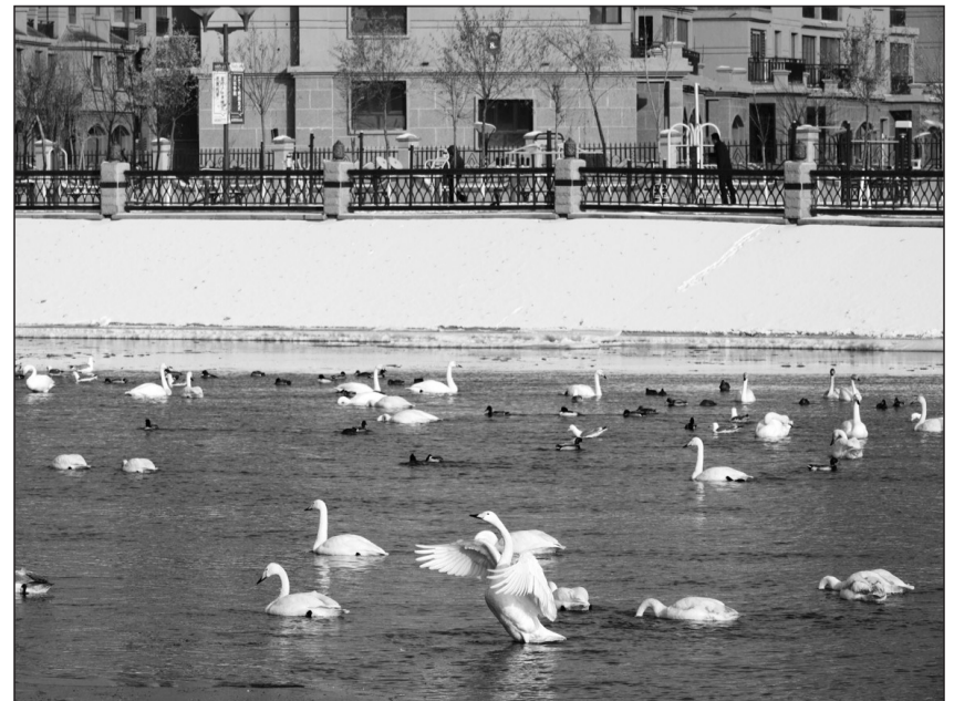
今年冬季到新疆维吾尔自治区库尔勒市孔雀河越冬的天鹅比去年同期增加100多只。近年来,随着库尔勒市生态环境的日益改善,越来越多的天鹅到此越冬。

据了解,宜昌市被列为全国首批12个环境总体规划编制试点城市之一。《规划》的编制和实施,对宜昌市科学合理规划城市空间布局,推进新型城镇化发展,提高生态文明水平、加快全面建成小康社会具有重要意义。