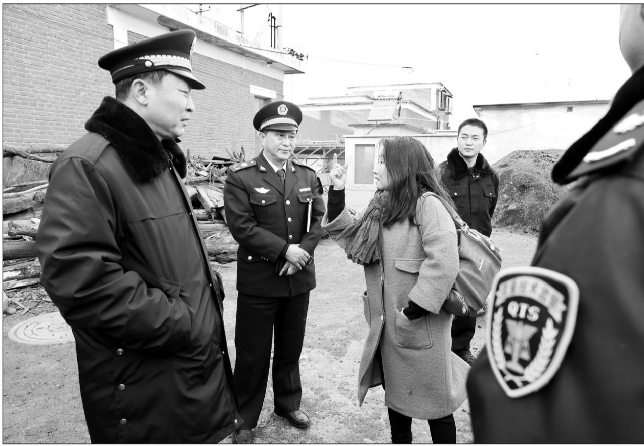
北京市环保部门与质监部门加强合作,对燃煤使用情况实施全过程监管,在采暖季对全市燃煤锅炉开展联合综合执法检查。图为北京市环保、质监两部门执法人员日前在门头沟区的北京泰顺科工贸中心进行检查。

自治区发改委相关负责人表示,将把巴楚县城乡饮水安全工程列为2015年自治区重点建设项目,协调配合有关单位加快落实开工前的各项准备工作,加强项目的全过程管理,加大后续补助投资的落实,确保工程顺利实施,按期建成发挥效用。杨涛利