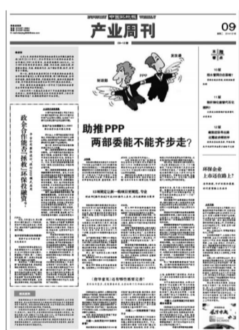
图为2014年12月16日报道,解读比较财政部和国家发改委同一天发布的3份PPP文件。

尽管在污水、垃圾等领域,早已有了政企合作模式的实践,但PPP从未像今年这样得到了从决策部门到地方政府的高度重视,政策密集发布,试点快速推进。由于地方政府普遍面临债务风险和融资困局,其对引入社会资本参与基础设施建设、化解地方债务风险的意愿非常强烈。