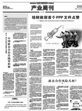
图为2014年10月28日报道,解读财政部首个PPP文件《关于推广运用政府和社会资本合作模式有关问题的通知》。