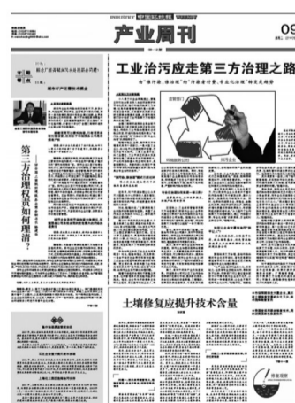
图为2014年6月10日报道,提出由“谁污染,谁治理”向“污染者付费,专业化治理”的转变是趋势。