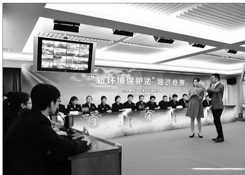
图为天津市环保系统新修订《环境保护法》知识竞赛决赛现场,主持人向参赛代表队提问。

代表队荣获二等奖,武清区环保局、南开区环保局、东丽区环保局、红桥区环保局代表队荣获三等奖。 据天津市环保局法制处相关负责人介绍,此次知识竞赛分为初赛、复赛、决赛3个阶段。初赛由组队单位自行组织开展,复赛、决赛由天津市环保局统一组织进行。 为推进和深化新修订《环境保护法》的贯彻实施,增强全市环保系统依法行政能力,提高执法效率,天津市环保局自2014年下半年开始,在全市环保系统组织开展了学新法、懂新法、用新法大学习活动。经过个人自学、集中培训、考核验收等环节,全市环保系统依法行政意识、法律条文熟知度、执法效能等均有明显增强。