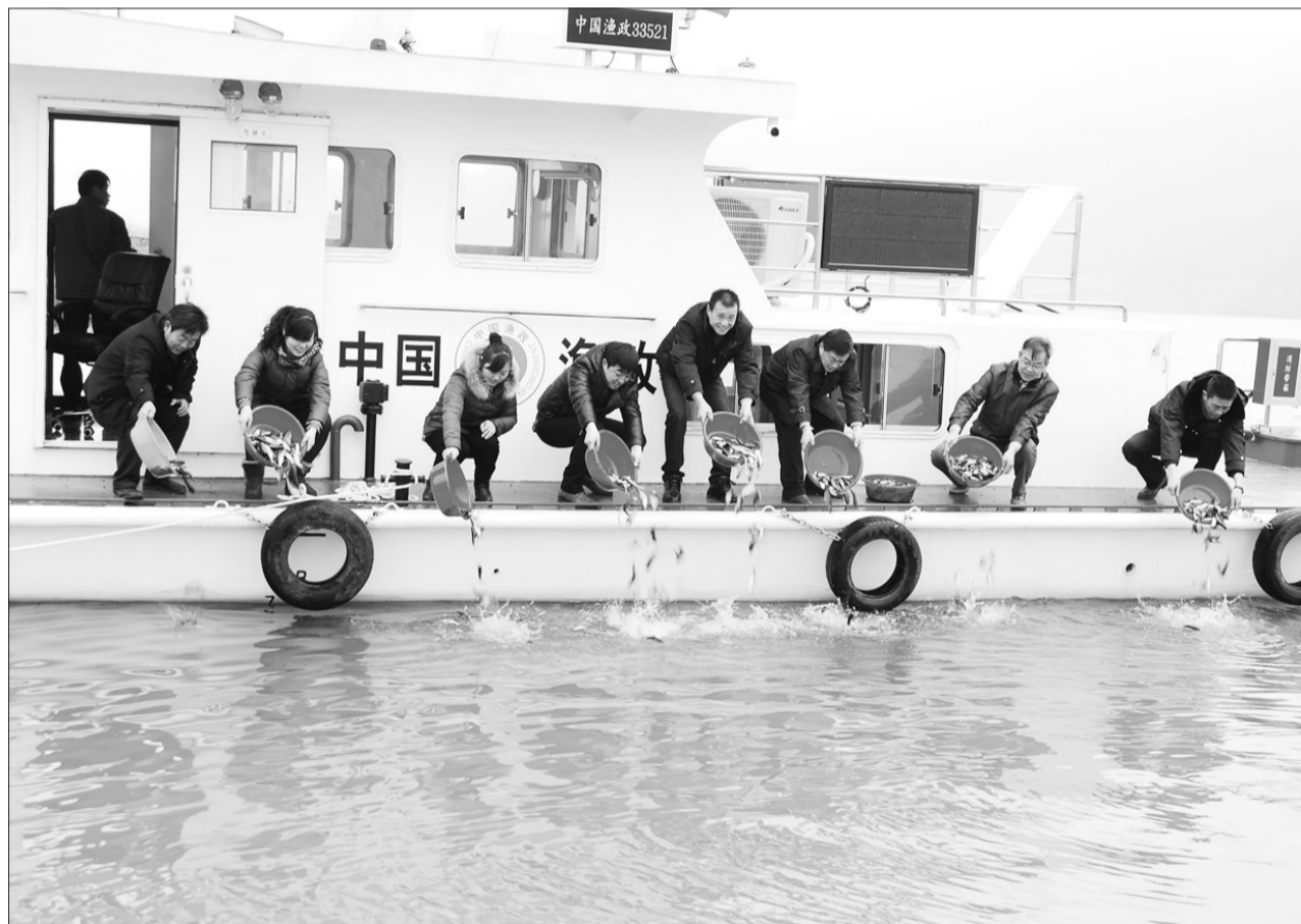
浙江省建德市水政渔政部门近日组织人员在富春江库区水域投放了180多万尾鱼苗,以丰富渔业资源,保持生态平衡,助力“五水共治”。