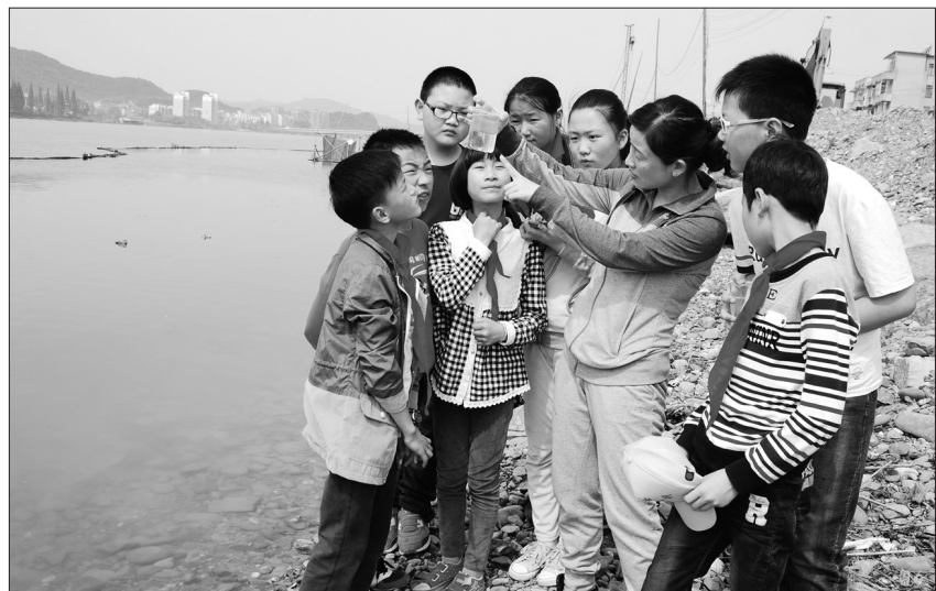
浙江省建德市梅城中心小学“水未来”学生环保社团的50名环保小卫士近日在老师的带领下,来到新安江畔开展“水环保课堂”生态环境资源调查科普宣传教育活动。