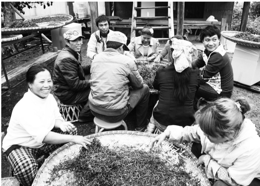
万亩古茶千年长青,绿了大地富了百姓。图为云南省勐海县勐混镇贺开村村委会的村民在贺开古茶山的茶叶晾晒房旁开心地筛分茶叶。