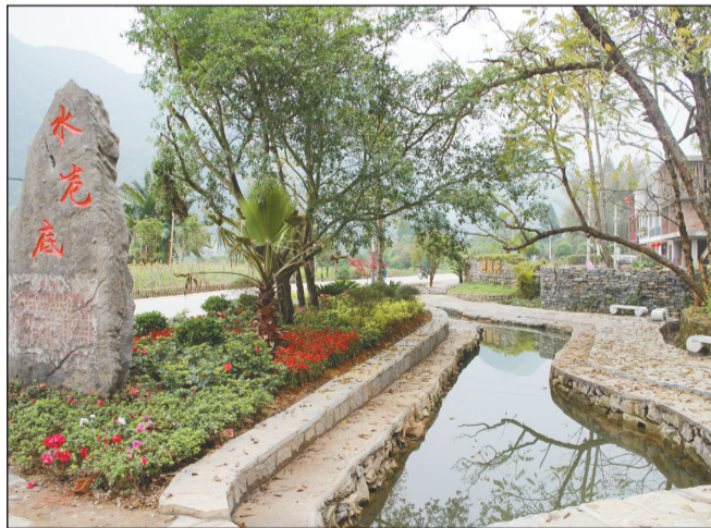
环境综合整治后桂林市阳朔县水壳底村风貌。

为深入持久开展改善农村人居环境,2013年,自治区成立了“美丽广西”乡村建设领导小组,由自治区党委书记、主席、副书记等7名省级领导担任正副组长,副书记主持常务工作,47个部门参与,领导小组办公室由自治区党委办公厅和政府办公厅牵头组建,全区各地各部门也相应成立了领导机构。