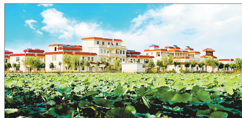
荷塘新城——平南县黄屋屯。