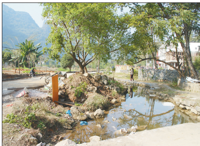
环境综合整治前的村貌。