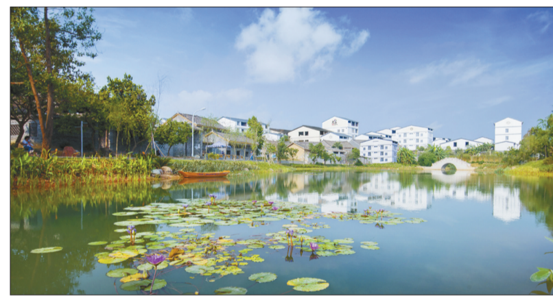
整治后的南宁市忠良屯美景。