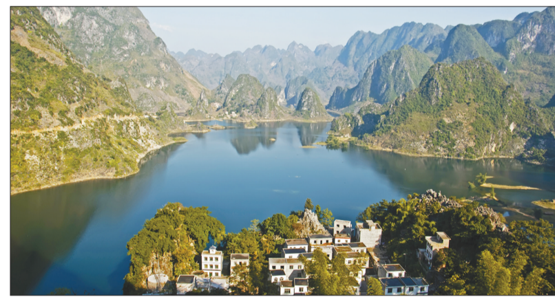
依山傍水的凌云县浩坤村。