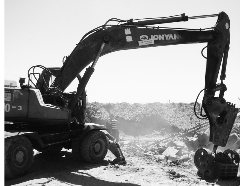
呼和浩特市开展青山前坡污染企业综合整治行动,图为工作人员正在拆除选场。