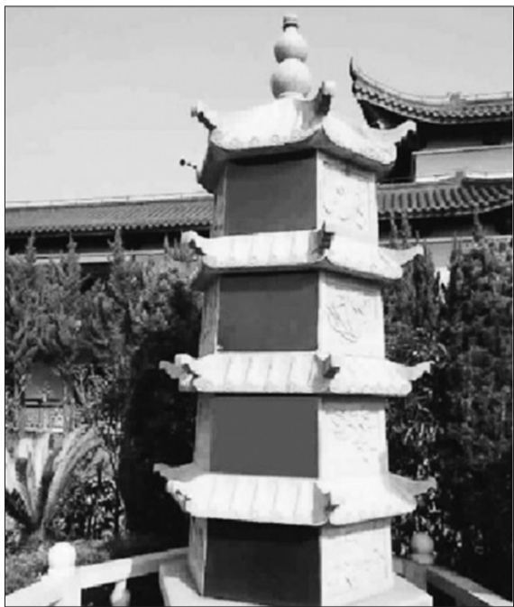
塔葬3平方米可以安葬5代人。 资料图片

上海殡葬行业协会负责人在接受记者采访时表示,随着葬式多样化成为趋势,加上市民对节地生