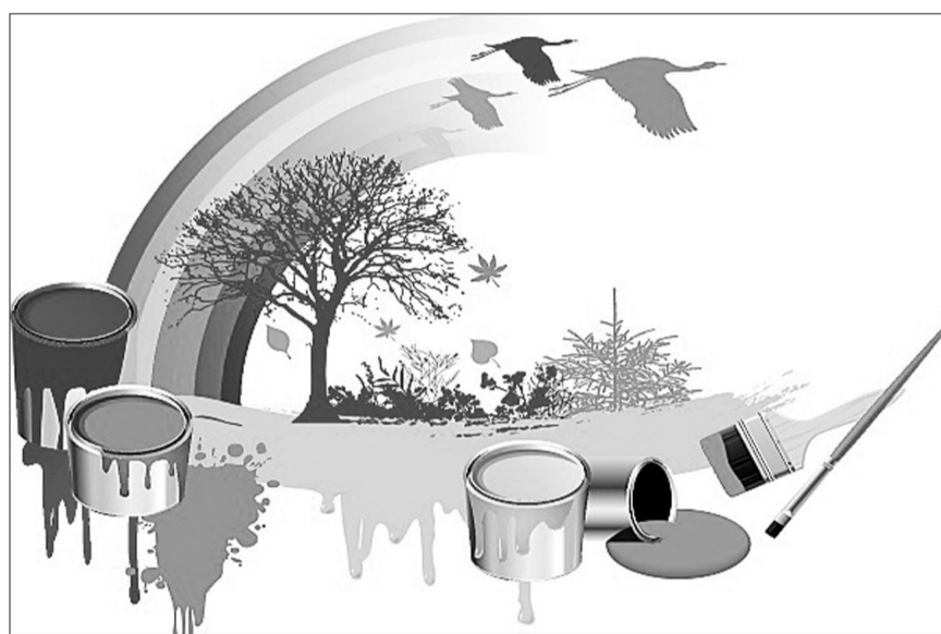
VOCs 治理成为石油化工、涂料油墨、工业涂装等行业企业需要高度重视的问题。

其中,VOCs 排污收费试点行业包括 12 个大类行业中的 71 个中小类行业,具体根据各行业污染排放占比