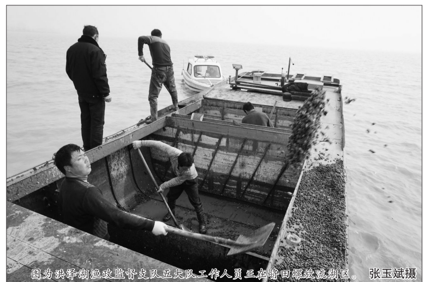
图为洪泽湖渔政监督支队工作人员正在将田螺放流湖区。

水产资源领域的专家认为,采用机动船拖网方式进行捕捞,会摧毁水体生态系统,破坏底栖生物的栖息地,打破生态平衡,导致水生生物资源锐减。田螺自身修复环境较缓慢,被破坏的生态环境虽然可以通过重新投放的方式进行修复,但很难达到预期效果。