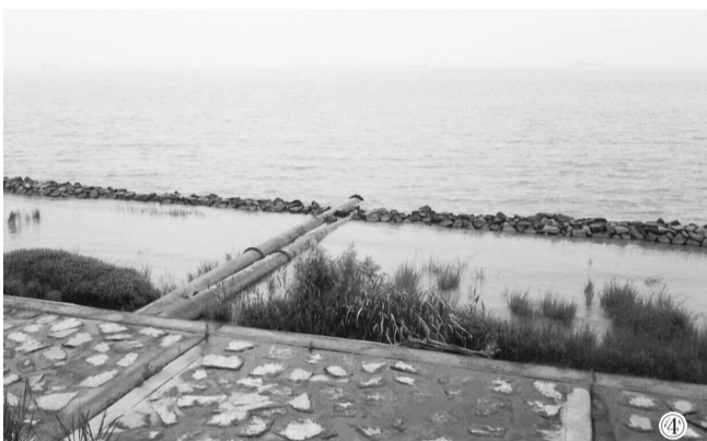
①图为存储上游企业含铜废水的罐体。②图为简易的提炼置铜车间。③图为未建污水处理设施的污水池及小型泵站。④图为污水通过泵站提升进入雨水管汇进水体的地点。