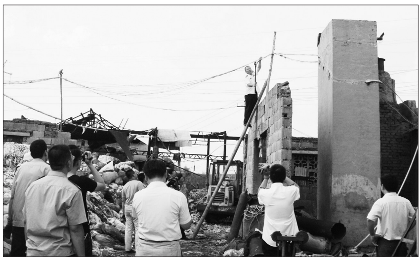
枣庄市市中区环保局日前联合公安、电力等部门对辖区内“土小”企业进行集中拆除取缔。图为执法人员切断“土小”企业供电线路。

等问题还不同程度存在,单纯依靠行政手段难以应对日益复杂的生态环境问题,迫切需要司法手段介入,携手共同推进环境治理。