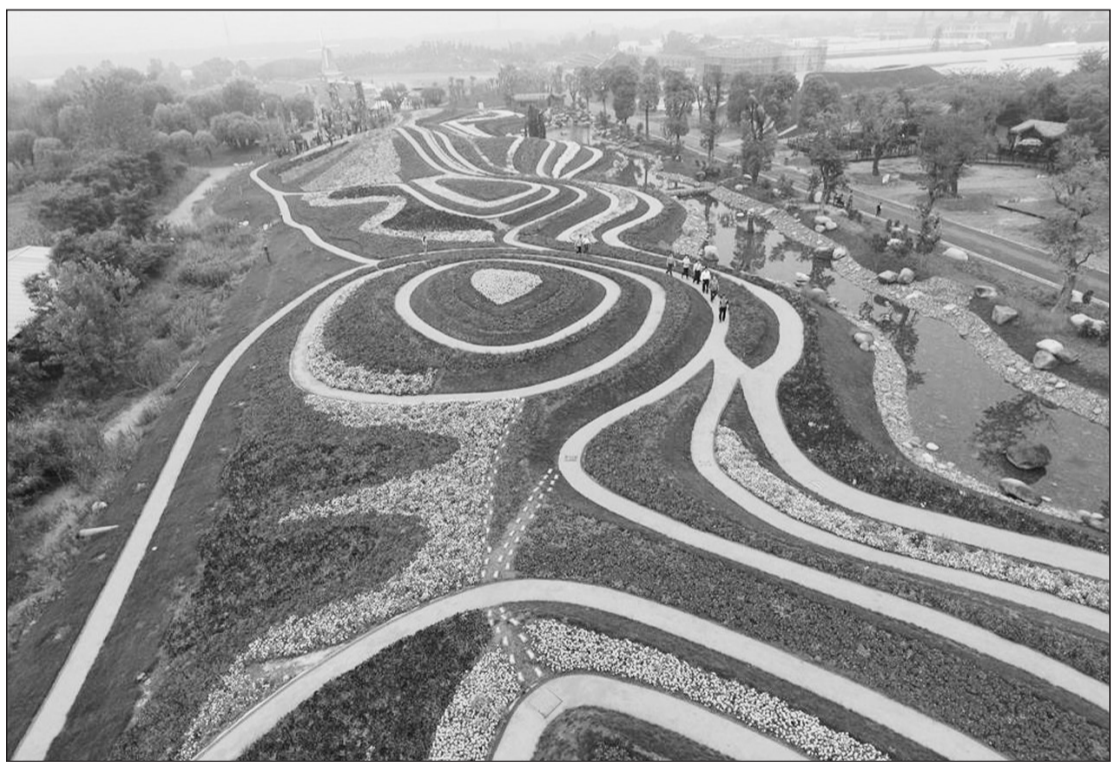
江苏南通绿博园汇聚了来自世界各地的数千种奇花异草,以生态园林的手法展示各种珍稀植物。图为5月26日航拍的绿博园,艳丽的色彩形成富有韵律感的线条,彩条交织宛若“调色盘”。

据了解,目前,全市各县(市)环保部门均已制定了中高考期间噪声污染防治应急预案,设立突发环境噪声事件应急处置预备队,并配备环境应急监测车,对影响中高考顺利进行的突发环境噪声事件进行紧急查处。同时,将严格执行“12369”环保举报热线24小时值班制度,保证事事有结果、件件有回音。 李春晖 张孝生