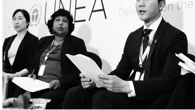
“北京市环保公益大使”李晨近日出席在内罗毕联合国环境规划署总部举办的第二届联合国环境大会,宣布了致力于环保理念传播和扶持青年环保科技研发的“跑蓝计划”。“跑蓝计划”筹集的资金,将由中华环保基金会和中国扶贫基金会的专项基金进行管理并组织项目实施,其中,预计70%的资金用于国内,主要包括公众宣传示范,大学生环保创意支持,以及青年环保创新创业孵化器扶持;30%用于联合国环境规划署与空气污染治理相关的全球项目。 本报记者邓佳媛