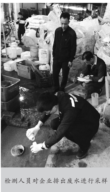
检测人员对企业排出废水进行采样

黄总:我们将进一步加强对员工的培训,提高职工环境保护意识,同时,加强对管理层的约束,提速环保设施改造,保证以后做一个遵纪守法的好企业。