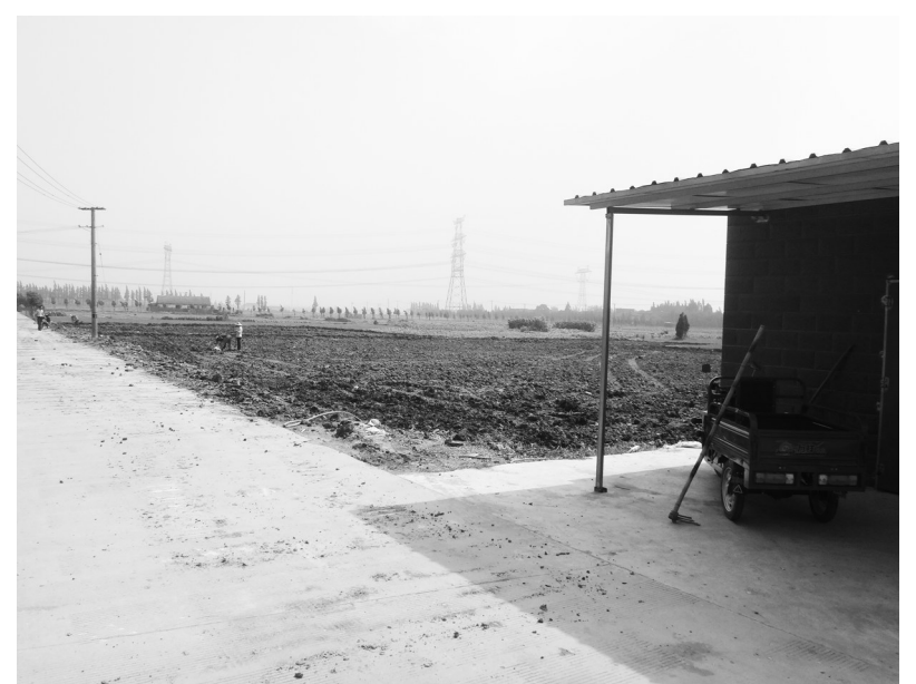
上海森托木业有限公司经过清拆整治后,土地平整,环境改善。