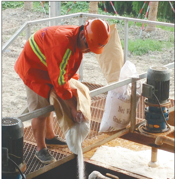
杭州市下城区在全市首创城市河道长效清淤模式。图为工人正在往淤泥中添加药物。