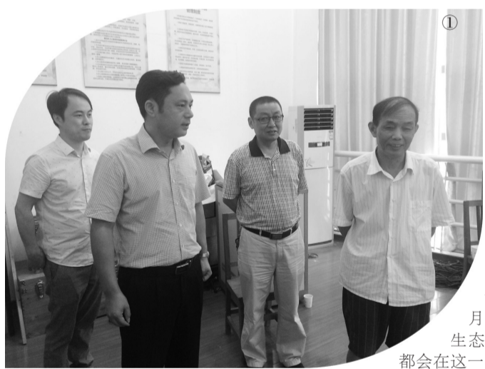
七届人大常委会第二十四次会议审议通过并通过了重要决议,将每年的8月15日设为湖州生态文明日。全市都会在这一天,组织开展多项宣传教育活动,促进公众参与环保,形成全民共建生态文明的良好氛围。

今年的8月15日是第二个湖州生态文明日,围绕“践行绿色生活 共建生态文明”的活动主题,湖州市环保局开展了慰问民间环保公益使者、走访环保老同志等“走基层·生态行”系列活动。