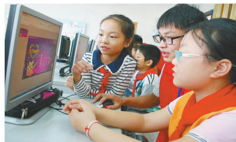
江苏大学志愿者日前走进镇江市朱方路小学,带领外来务工人员子女开展“电子贺卡谢师恩”活动。志愿者指导他们制作电子贺卡,学习二维码扫描技能,并通过微信、QQ等环保的方式,向老师表达教师节的祝福。图为学生们在学习制作电子贺卡。