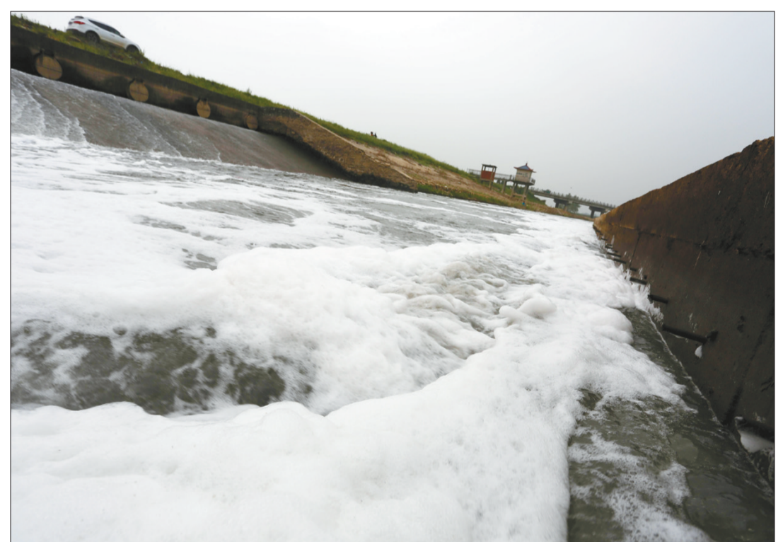
江西省瑞昌市赛湖排灌站向长河排水,污水从排灌口倾泻而出,在水渠中堆积起半米厚的泡沫,空气中弥漫恶臭。据瑞昌市环保局负责人介绍,出现这种情况,是因为瑞昌老城区污水管网不完善,未经处理的污水出现外溢。

会上,赵英民与东盟秘书处秘书长及各国外代表共同启动了“中国—东盟生态友好城市”发展伙伴关系。论坛期间,赵英民与阿萨凯瓦提进行了会谈,双方就加强中国—东盟环境合作、共建绿色“一带一路”、落实中国—东盟环境合作战略(2016-2020)、建立中国—东盟生态友好城市发展伙伴关系等共同关心的话题交换了意见。赵英民还参观了“中国—东盟环保技术与产业展”,与参展企业代表进行了交流。 论坛由中国—东盟环境保护合作中心、广西壮族自治区环保厅和南宁市政府承办。来自东盟成员国的高级官员、联合国环境规划署、斯德哥尔摩环境研究所等国际机构的代表,以及我国环境保护部、广西壮族自治区政府、地方环保部门、国内外专家学者和企业界代表200余人出席论坛。