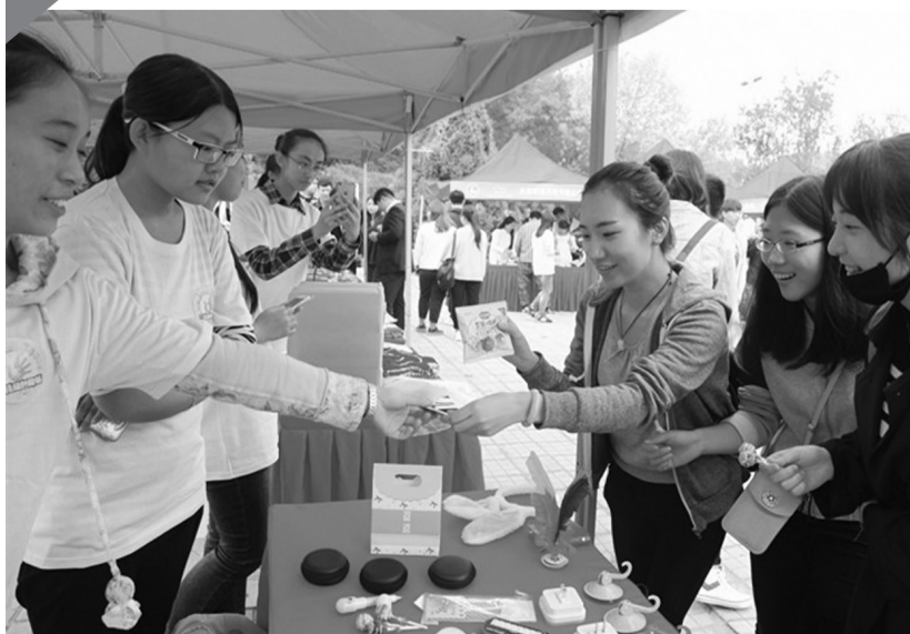
图为大学生相互交换自己不需要的发卡、衣帽钩等物品。