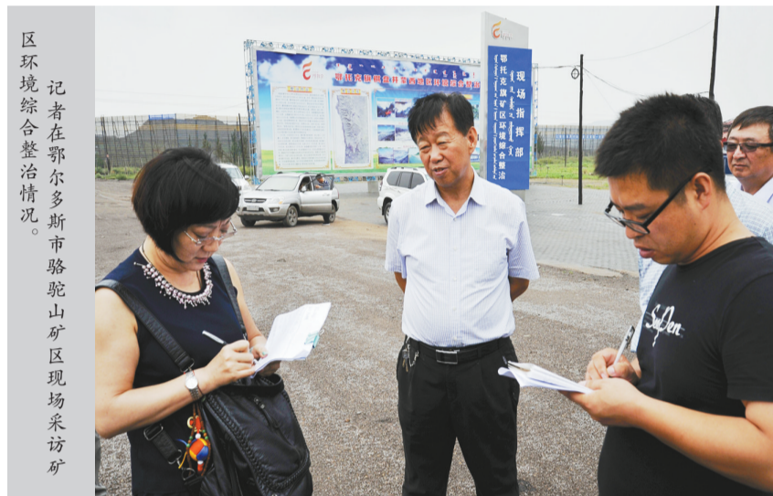
记者在鄂尔多斯市骆驼山矿区现场采访。

日前,记者就乌海市及周边地区环境综合整治情况走进乌海市、鄂尔多斯鄂托克旗棋盘井工业园区、蒙西高新技术工业园区阿拉善经济开发区等地进行了实地采访。