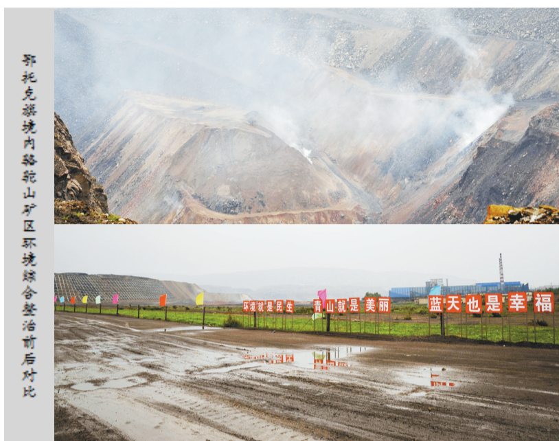
骆驼山矿区环境综合整治前后对比

鄂尔多斯市是乌海市及周边地区矿产资源最为集中的区域,乌海市与鄂尔多斯市在这里“握手”,矿区周边除了大大小小的矿山企业,遗留的采矿废坑和散堆排土场众多,矸石自然和道路扬尘污染集中,环境综合整治任务艰巨。