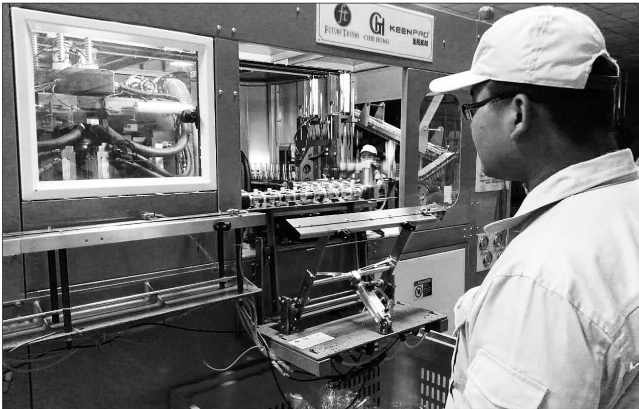
国内首条生物全降解矿泉水瓶生产线日前在吉林省白山市抚松县漫江镇正式启用,矿泉水的瓶身可在一年内完全降解于土壤之中。矿泉水全瓶身,包含瓶标、瓶盖,皆是生物全降解包材,能够有效解决白色污染问题,逐步替代塑料制品。

据悉,自阻燃型聚氨酯不添加任何阻燃剂,绿色环保,物理性能稳定。遇火后不流淌,没有滴落物,产烟量极低,采用太空碳化技术,遇火急速形成碳化层,紧密而有强度的结膜层形成一道防火墙将火焰与建筑隔绝,使火焰不再扩散和向建筑物内燃烧。苏文