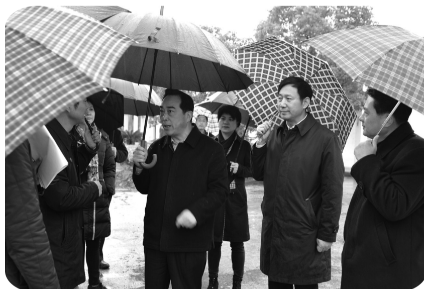
12月13日上午,中共盐城市委书记王荣平冒雨来到通榆河饮用水水源地保护区,检查中央环保督察反馈水环境问题整改落实情况。

把使命记在心上,把责任扛在肩上,把工作抓在手中,以系统工程思路抓生态建设,把环境治理作为重大民生实事落实落地,这正是盐城走发展与保护双赢之道的密钥。