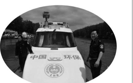
盐城市饮用水水源地环境执法巡查

后,市委市政府认真抓好中央第三环保督察组反馈问题整改落实,成立领导小组,制定整改方案,逐项对账销号,受到了人民群众的好评和中央环保督察组、江苏省领导的肯定。