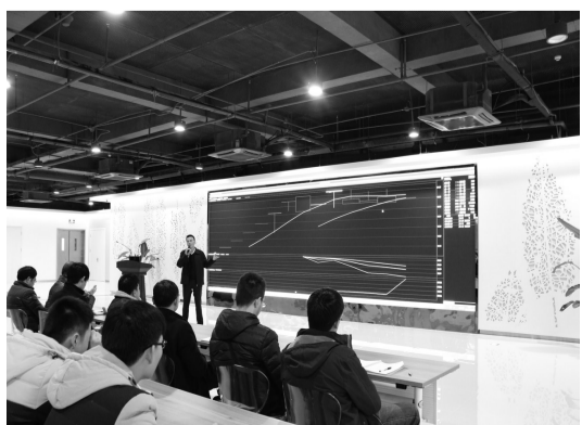
盐城环科城碳排放交易市场