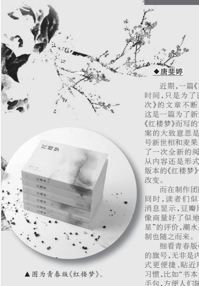
▲ 图为青春版《红楼梦》。

然而,以何种方式让经典流行?让经典流行的前提和最终目的是什么?是打着文艺的旗号最终实现消费经典的目的,还是以尊重老一辈传承者的成果为“基础”,还是通过某种程度上“标新立异”达到抬高自己身价、吸引不明真相的读者的目的?二者有本质区别。