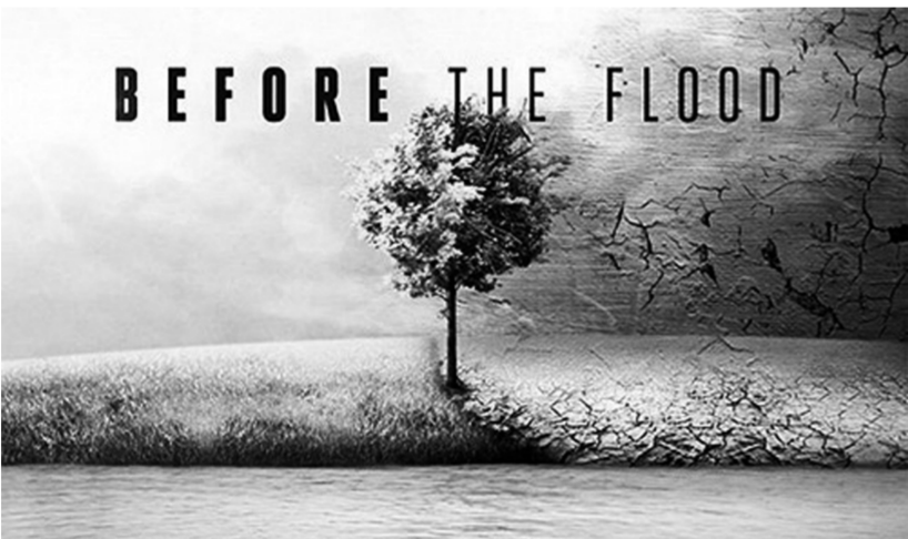
图为纪录片《洪水泛滥之前》海报。

但问题,远非如此简单。“印度30%的家庭,3亿人口用不上电。这相当于美国的全部人口。”苏尼塔将困境和盘托出。摆脱生存困境和应对气候变暖,让印度腹背受敌。“必须把改善生活水平和应对气候变暖作为谈判的中心。”苏尼塔的眼中,流露着焦虑、忧郁和悲伤。