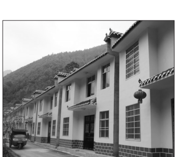
湖北巴东北界村易地扶贫搬迁安置点一期工程新建的楼房。