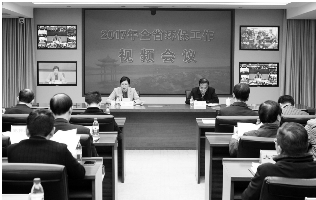
浙江近日召开2017年全省环保工作视频会议,省环保厅厅长方敏作工作报告。

2016年,浙江省环保系统在省委、省政府坚强领导下,积极践行“绿水青山就是金山银山”理念,深入推进“五水共治”,全面实施新一轮“811”美丽浙江建设行动,大力整治生态环境,倒逼产业转型升级,全省各地呈现出天更蓝、水更绿、山更青、城乡更美丽的新画卷。