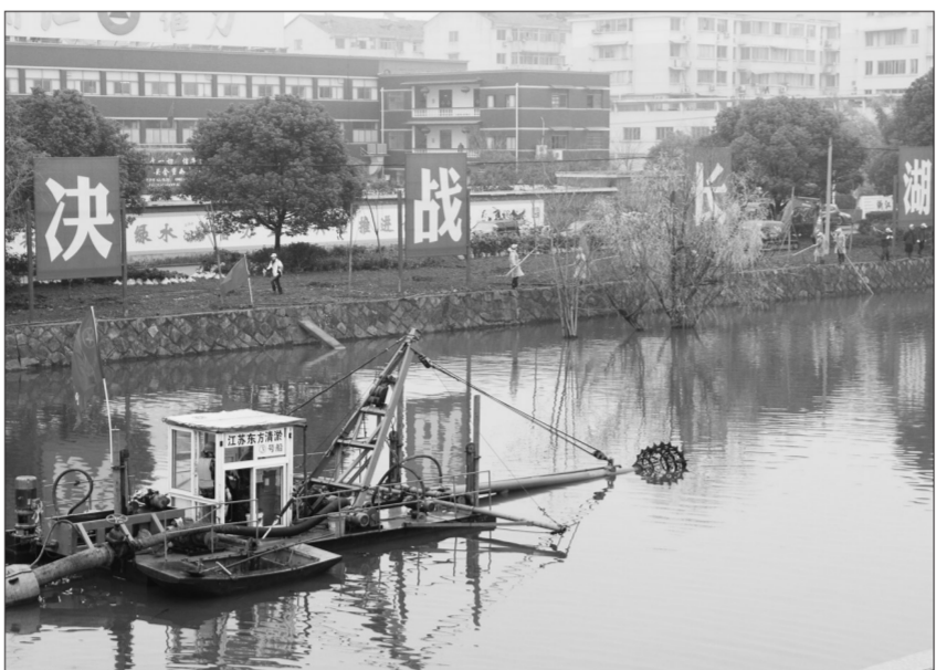
2016年,金华市通过深入开展“五水共治”,全市水环境质量提升实现了历史性突破。图为婺城区长湖清淤船在作业。

金华市环保局相关负责人表示,水环境问题往往是“污染在水中、根子在岸上、关键在人上”,《条例》正是针对水污染防治的这一关键点,对现有法律法规的有关规定进行了补充完善和创设突破,将为金华治水提供有力的法律保障。