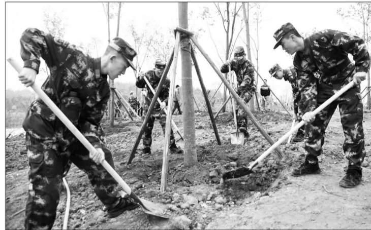
2017年广西壮族自治区“营造山清水秀自然生态”义务植树活动近日在南宁市邕宁区蒲庙镇举行,来自社会各界的群众与驻邕部队官兵共1000余人参与到生态环境建设中,为大地添绿。

土地整治制度和能力建设5方面提出了规划期土地整治的主要目标,确定了9项控制指标,明确了实施藏粮于地战略,大力推进农用地整理;围绕美丽乡村建设,规范开展农村建设用地整理;落实节约优先战略,有序推进城镇工矿建设用地整理;贯彻保护环境基本国策,积极推进土地复垦和土地生态整治;突出区域特色,分区分类开展土地整治5方面重点任务,并对资金和实施保障提出了要求。