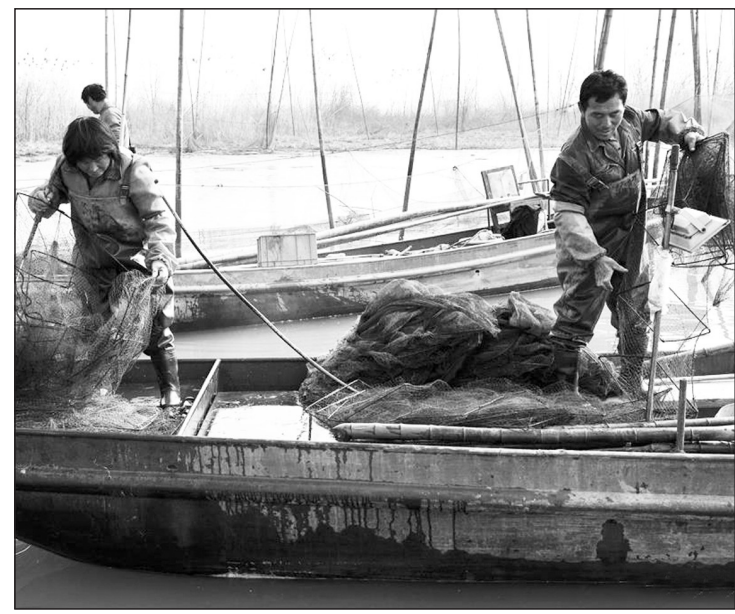
从3月1日0时至6月30日24时,葛洲坝以下长江中下游段将进入第16个春季禁渔期。江苏省镇江市和平路街道长江村长江沿线渔民近日纷纷拆除捕鱼网具,收网上岸支持长江春季禁渔。

用新任辽宁省环保厅厅长来鹤的话讲,环保工作要求真务实,以实实在在的成效,以环境质量改善来增强人民群众的满意度和幸福感。