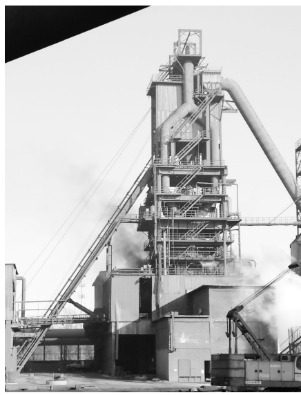
▲唐山市滦县兴隆钢铁有限公司3号高炉无组织排放严重。