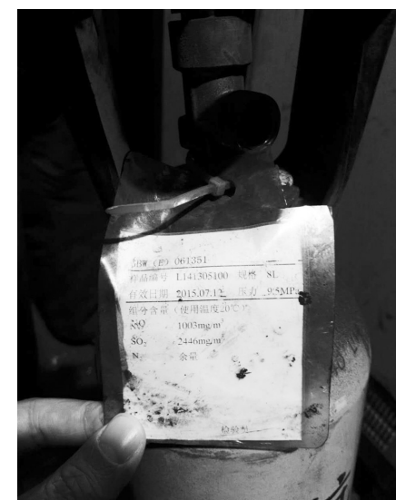
▲唐山市玉田县弘泰线材有限公司在线监测设施标气过期。