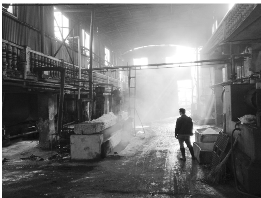
▲鹤壁市股都化工有限公司生产车间无组织排放严重。