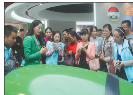
贺州公众评污活动走进华润电力(贺州)有限公司。

贺州市富川县莲山镇中学、红骑公益协会、各界环保志愿者及贺州日报、贺州电视台的媒体记者等代表，走进了华润电力(贺州)有限公司，深入生产现场了解脱硫、脱硝、除尘等污染治理设施运行情况，零距离感受了华润电力的生产流程、绿色环保理念及节能减排、污染治理的成效。