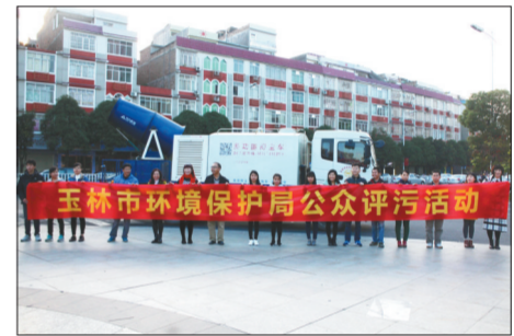
玉林市在文化广场举办公众评污活动。

玉林市通过《玉林日报》及微信新媒体平台刊登公告，组织学生代表、环保志愿者、热心环保人士，前往农村环境综合整治示范项目、玉林市爱民医疗废物处理有限公司以及降尘作业现场参观，畅通了公众参与渠道。