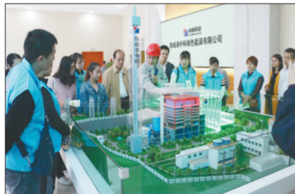
防城港公众在了解垃圾焚烧发电过程。

市民纷纷表示参观完活动后，了解了环保重点工程和环保设施设备，感受到环保工作人员为防城港的蓝天，默默做了很多事情。防城港市环境保护工作得到了公众的肯定，公众评污活动效果显著。