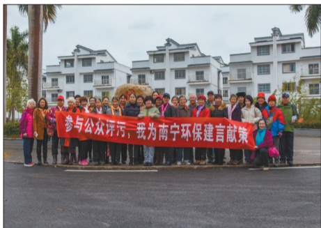
南宁农村生态环保公众评污，参观生态环境整治示范。

南宁市充分发挥新媒体作用，在“南宁环保”微信公众号发布活动预告，刊登活动报名信息。活动期间，共有媒体记者、学生、老师、工人、社区居民、人大代表、政协委员等200多人报名参加了“公众评污”活动。