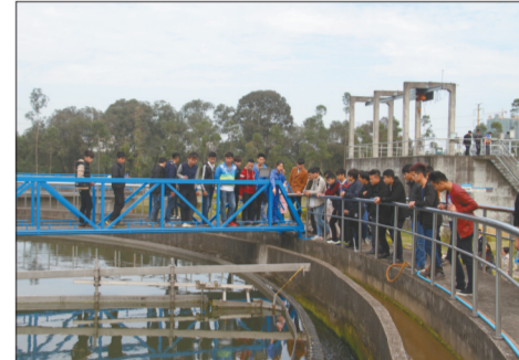
公众参观贵港市城西污水处理厂。

先进的生产理念。“这次活动让我亲眼见证了污秽不堪的污水经过处理变成了干净的清流，简直太神奇了。”市民们纷纷表示，这次活动不仅展示了贵港污染治理的成效，更让大家学到了很多环保知识，获益匪浅。