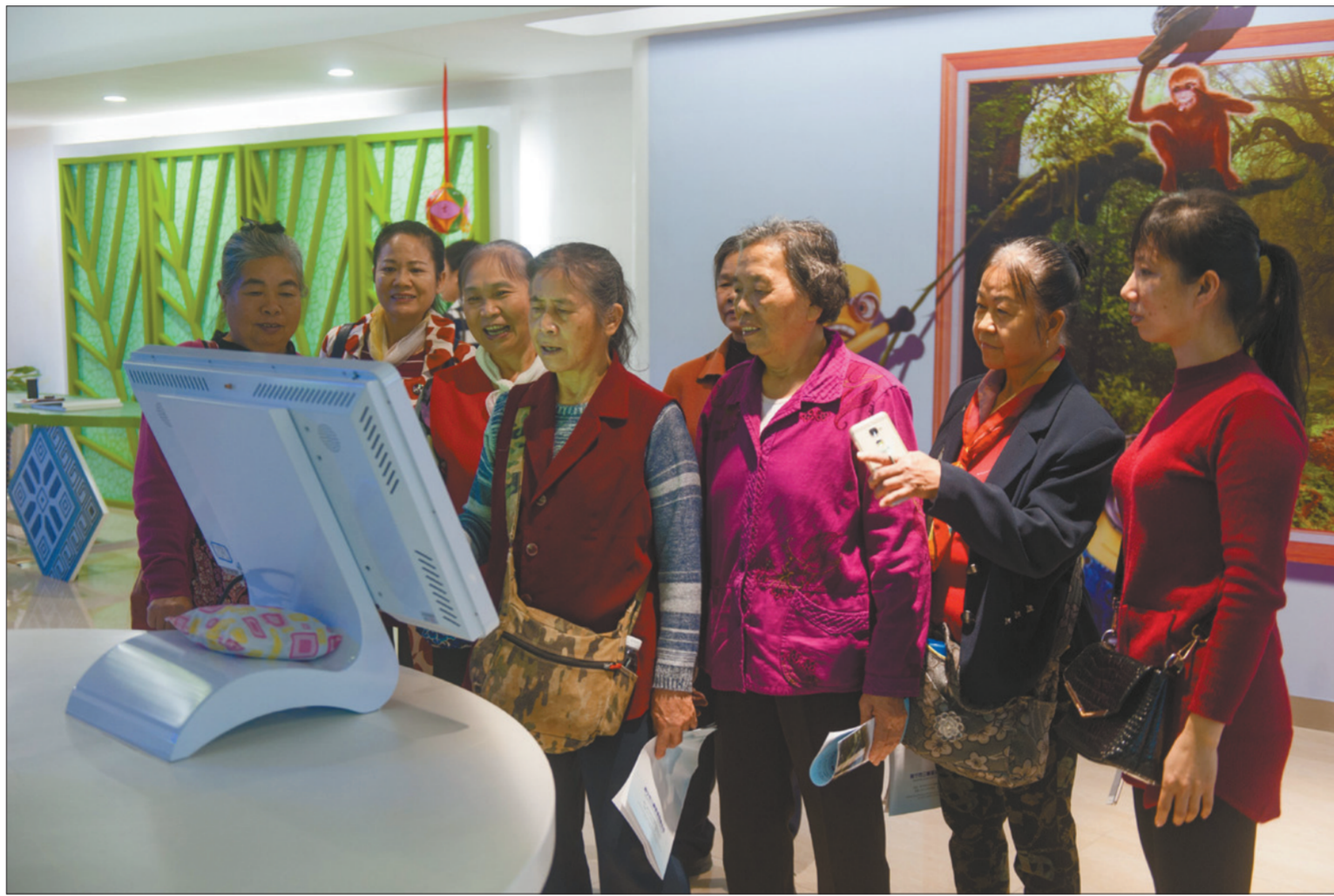
公众评污活动中，人们走进南宁环保发电厂了解固体废物污染防治。

市民代表等前往污水处理厂、无公害垃圾处理厂、垃圾焚烧发电厂、医疗废物处置中心等实地参观，近距离感受环保与生活的“密不可分”。