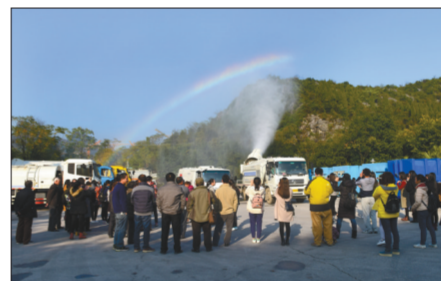
桂林市民在环卫处停车场参观雾炮车演示。

桂林市围绕“水污染防治”和“大气污染防治”主题，组织公众前往污水处理厂和降尘作业现场进行参观，广泛利用电视、广播、报纸及网络平台，积极邀请、动员社会公众报名参与“公众评污”活动，环保志愿者、大学生代表、中小学生代表、社会各界人士、媒体记者等400多人参加活动。