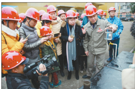
在柳钢污水处理站，工程师为大家展示经净化的工业用水。

柳州市邀请市人大代表、政协委员和大学教师、工人以及普通群众等组成“评污团”，一起走进广西柳州钢铁集团有限公司，参观了解污染防治设施运行情况及有关的环保和污染防治措施，现场开展了环保法律法规宣传和环保知识咨询解答。