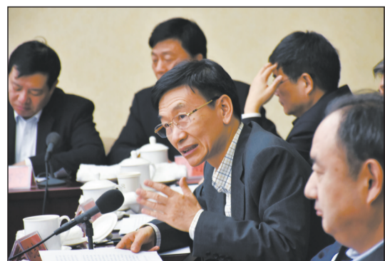
在全国政协十二届五次会议小组讨论中,全国政协委员、九三学社广东省委主委姚志彬建议,要加强政协民主监督,为推动生态文明建设建言献策。