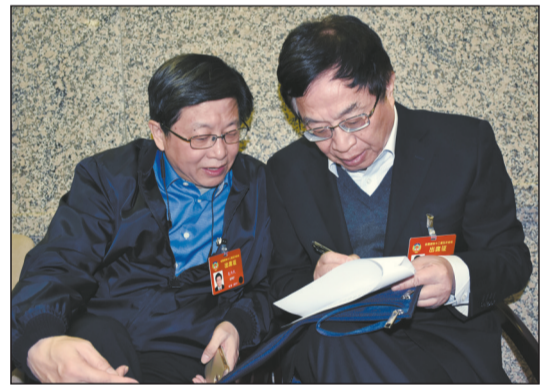
在全国政协十二届五次会议小组讨论间隙,全国政协委员、航天院士叶培建和包为民讨论今年的提案。