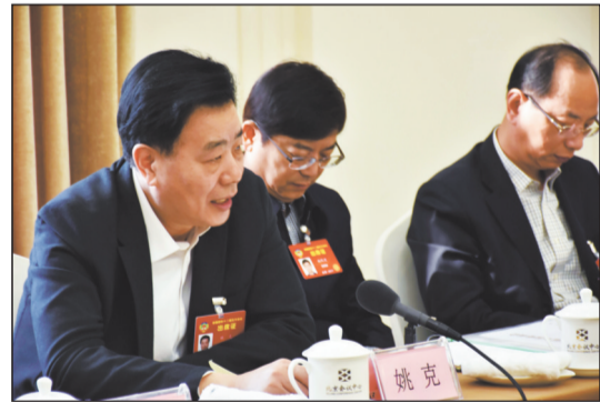
在全国政协十二届五次会议小组讨论中,全国政协委员、浙江大学第二医院眼科中心主任姚克提出了有关环境保护的建议。