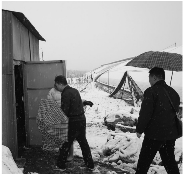
3月10日~20日,陕西省环保厅组织开展了第一季度空气质量专项督查。图为督查人员冒雪检查杨凌秦山现代农业股份有限公司大棚燃煤锅炉。