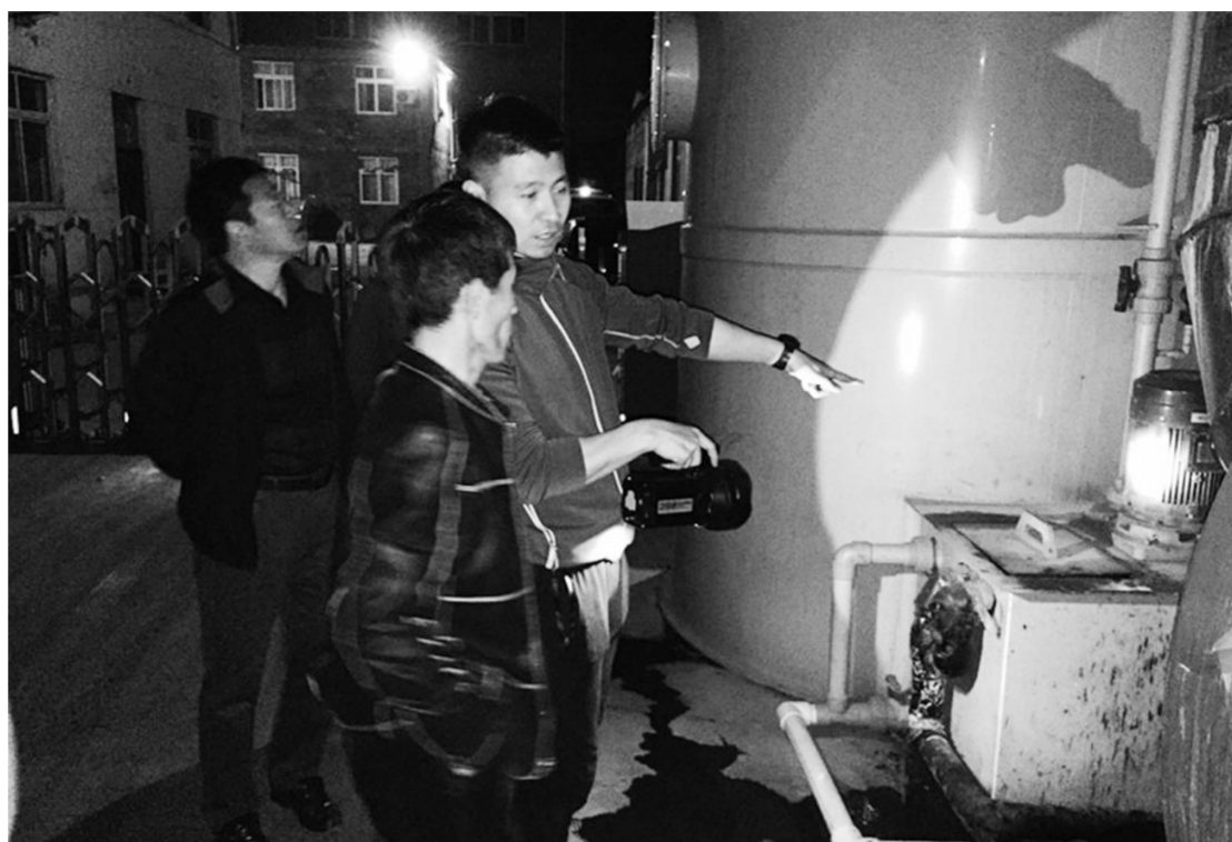
图为4月6日晚,天津市环保局和青西青区环保局执法人员突击检查企业落实重污染天气应急响应措施情况。