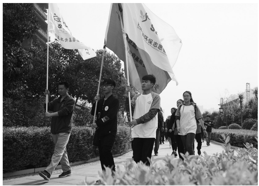
图为参加活动的志愿者行走在西安汉城湖边。