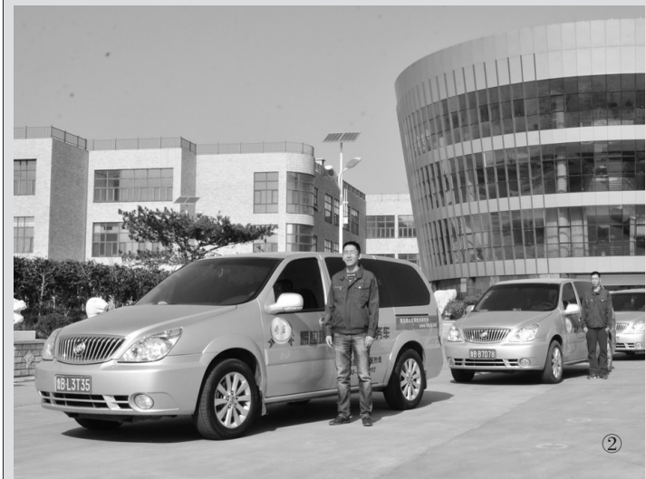
图①为崂应客服人员对客户单位进行巡检。图②为崂应环保技术交流服务车整装待发。