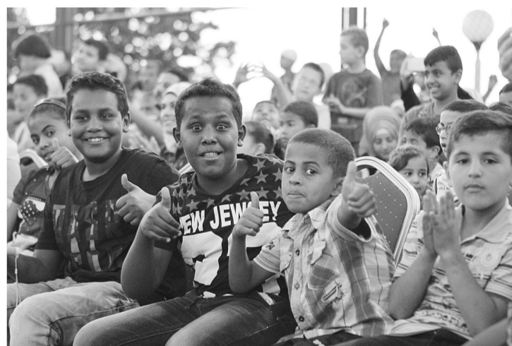
▲ 图为约旦小观众为中国艺术家的表演点赞。