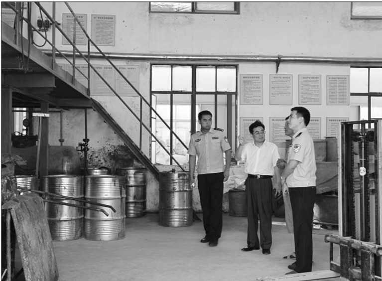
海安县环保、检察、公安3部门联合“双随机”执法检查。

四是规范抽查制度。按照属地管理原则,随机选派环境执法人员,对列入随机抽查名单中的污染源进行现场抽查。使用移动执法平台,对随机抽查名单保密。 记者了解到,今年,海安县环保局建立了全县污染源“双随机”抽查库。抽查库共纳入943个污染源,其中,国控源7个、重点源183个、一般源753个。 抽查对象原则上是全县重点排污单位;国控源按照每季度25%的比例,开展日常监管;其他污染源单位,按照每季度5%的比例开展日常监管;对于一般排污单位,按照1:1.5(在编在岗的环境监察人员数量与被查单位数量的比)的比例,确定年度抽查单位数量,开展日常抽查监管。