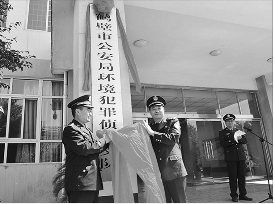
近日鹤壁市公安局举行环境犯罪侦查支队揭牌仪式。

本报记者刘俊超 邵丽华报道 河南省鹤壁市公安局日前在人民警察培训学校,隆重举行环境犯罪侦查支队揭牌仪式。 为应对环境污染问题严峻形势,切实加大对环境污染违法犯罪案件侦办力度,按照鹤壁市机构编制委员会《关于市公安局增设环境犯罪侦查支队的批复》要求,鹤壁市公安局经认真研究,近日正式成立环境犯罪侦查支队。 据介绍,成立环境犯罪侦查支队,是鹤壁市委、市政府关注民生、回应人民群众期盼的重要举措,对于打击环境犯罪、保障人民群众健康安全具有重要意义。 环境犯罪侦查支队成立后,将按照新形势、新体制、新任务要求,紧扣人民群众关注和关心的热点问题,深挖犯罪线索,严打违法犯罪,切实履行好保民生、保环境的重大责任。