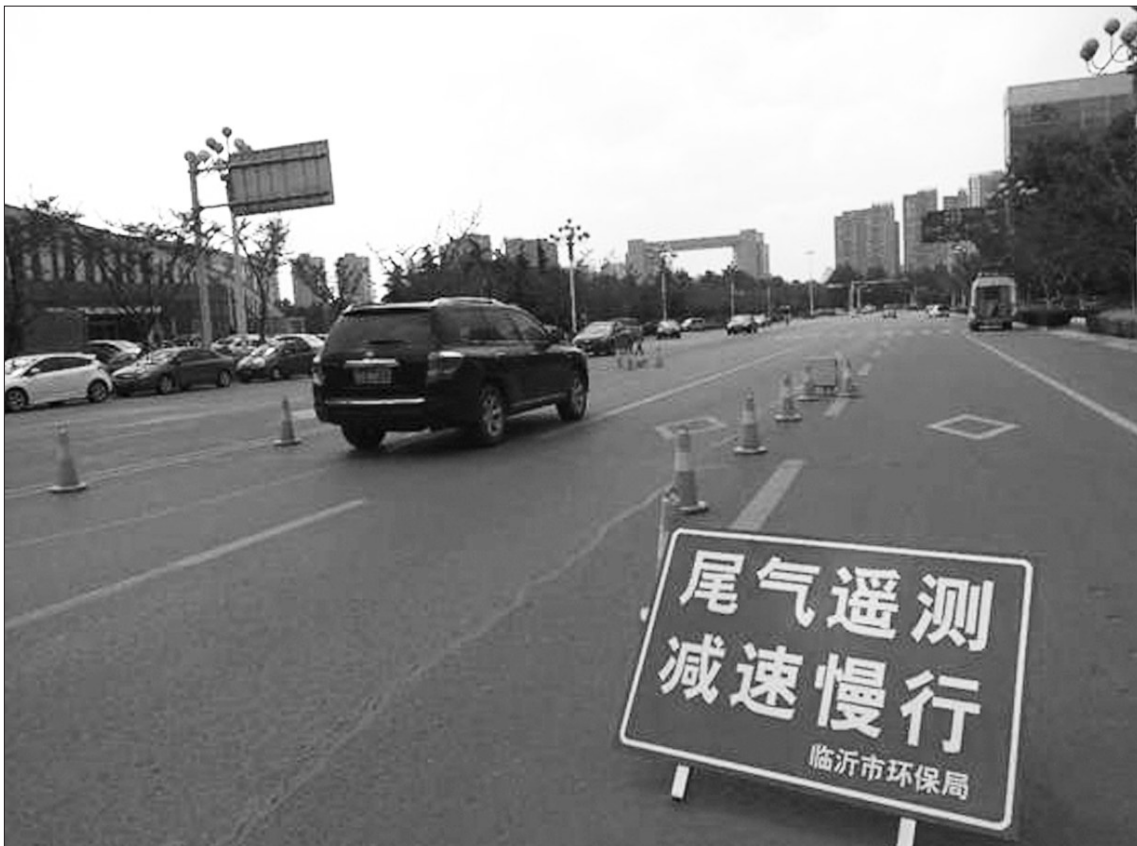
山东省临沂市环保局机动车监控中心日前在市区主要路段设点对机动车尾气排放进行道路抽检,加大对尾气排放超标车辆的治理力度,推进机动车尾气污染防治。