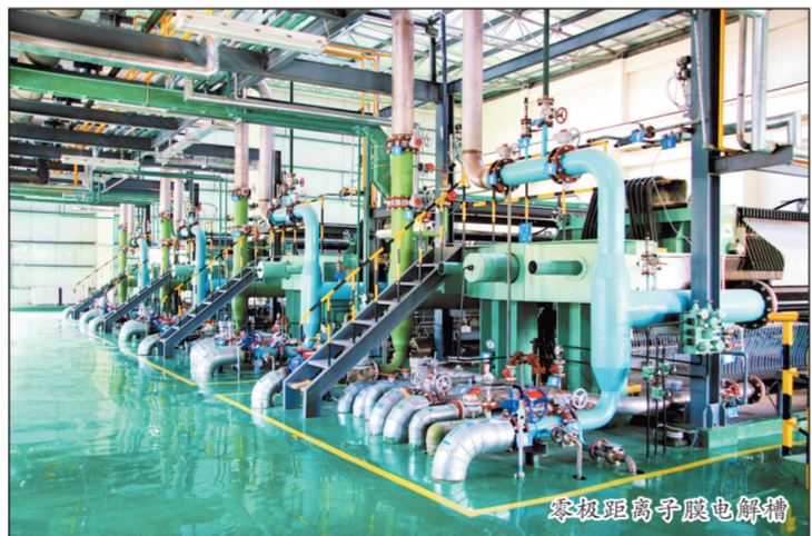
零极距离子膜电解槽

生态文明建设取得的良好成效,不仅能为公司长远战略发展注入活力,同时也有助于消除外界对化工生产企业的疑虑,营造了良好的外部环境。