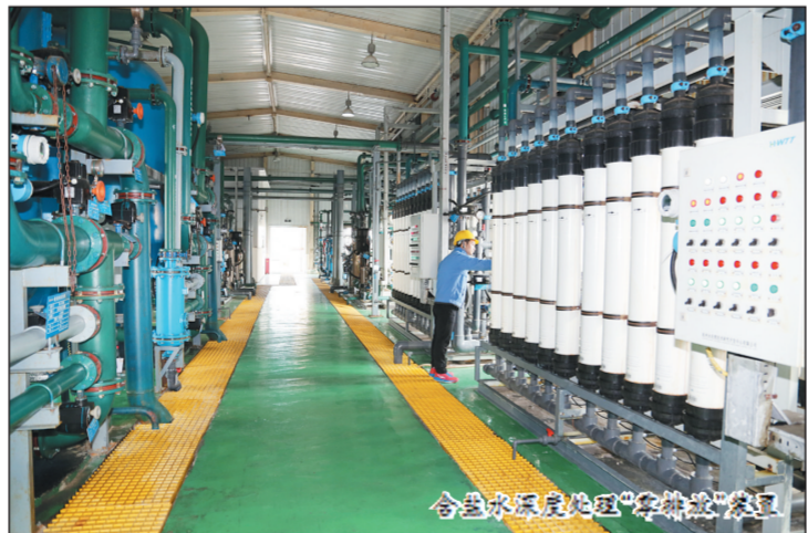
含盐废水处理“零排放”装置