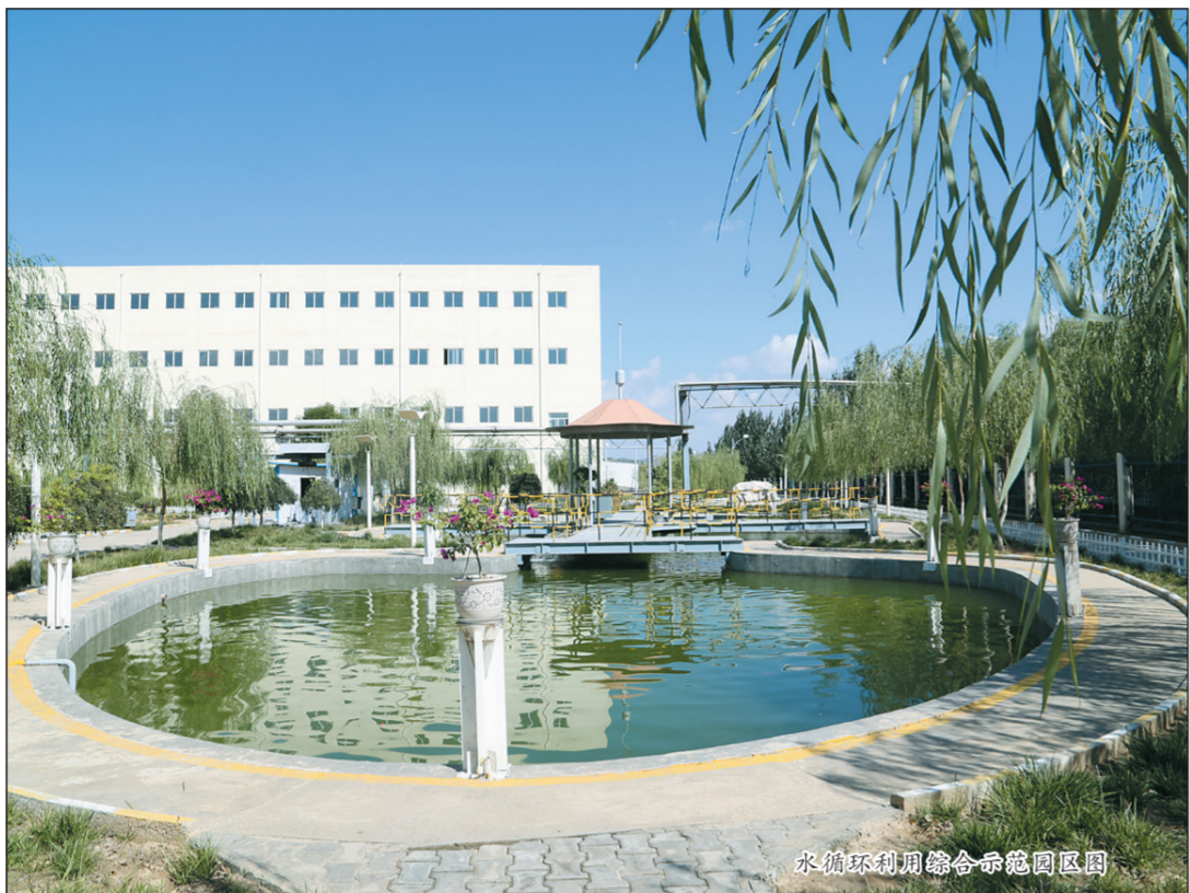
水循环利用综合示范园区图

金泰氯碱凭借良好的社会责任意识,发挥深厚的“本质化”管理优势,以技术创新为突破口,大力投入企业环保治理,努力发展循环经济,深入推动节能降耗,成功开辟了一条绿色可持续发展道路。