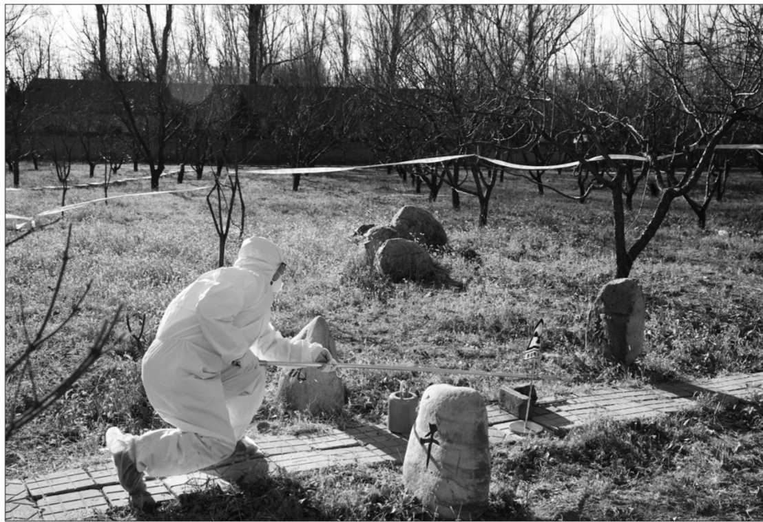
图为辐射应急演练现场。

“一带一路”国际合作高峰论坛落下帷幕不久,北京市环境保护局就收到了一封来自环境保护部办公厅的感谢信,感谢其在论坛召开期间所做的辐射安全保障与辐射事故应急工作。