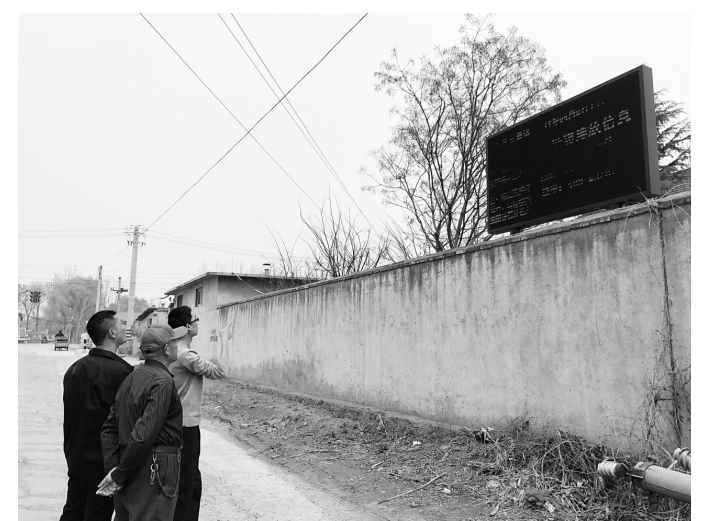
图为莱芜市民观看企业的实时排污信息。