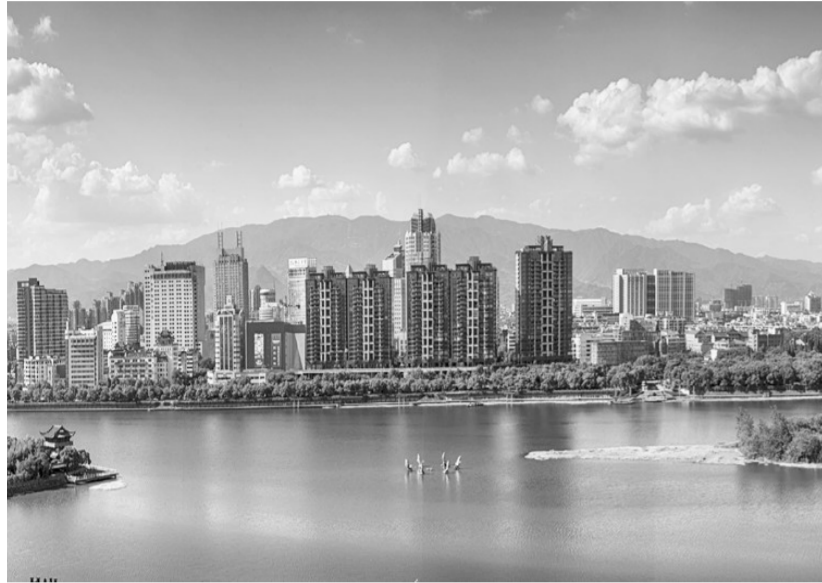
秀美金华三江口。

金华市以“八八战略”为指引,以“走在前列,共建金华”为目标,努力践行“绿水青山就是金山银山”的发展理念,坚持“经济生态化、生态经济化”,通过环境治理倒逼转型升级,让绿水青山转变成了金山银山。