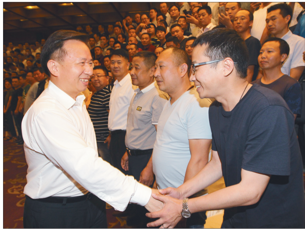
环境保护部部长李干杰6月28日在京看望京津冀及周边地区大气污染防治强化督查第四期培训班学员。

李干杰对下一步推进强化督查工作提出三点要求:一是提高站位。要旗帜鲜明讲政治,牢固树立“四个意识”,深入学习领会习近平总书记关于大气污染防治的重要指示批示精神,把维护核心落实到坚决完成强化