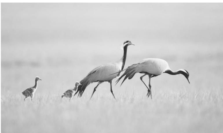
▲图为获奖作品《苍衣鹤一家》。

大赛展出了部分获奖作品。青年人以其独特的视角观察生活、感悟生活,用凝固的瞬间记录下身边的美好时刻,诠释了人类对和平、友爱、绿色、人与自然和谐共处的热爱与憧憬,传递出各国青年对环境保护、绿色发展的关注。