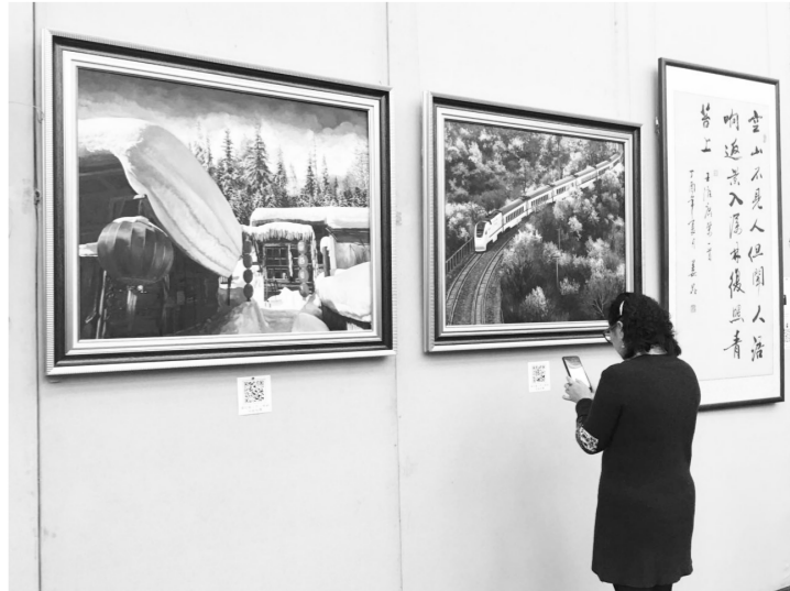
图为观众在扫描二维码,为喜欢的作品投票。

这批作品还将在江苏省江阴市、河北省青州市等地巡展。主办方希望,通过举办展览,让参观者不仅获得艺术的感染、文化的熏陶,更能得到一次环境教育的洗礼,推动引导全社会关心环境、保护环境、改善环境。