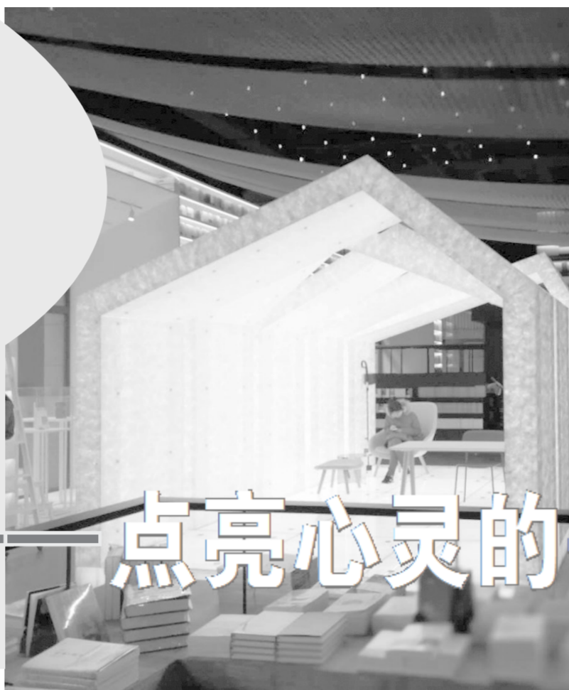
上图为北京三联韬奋书店内景。 左图为北京坊Pageone书店内景。