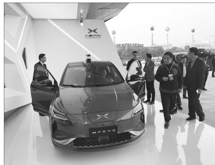
小鹏汽车智能新能源汽车整车项目今年正式落户广东省肇庆高新区,项目计划总投资100亿元,向肇庆打造新能源汽车千亿产业集群迈出坚实一步。小鹏汽车以互联网汽车产品为基础,应用新技术新工艺和新的商业模式,提供优质的产品体验和更智慧的出行解决方案。